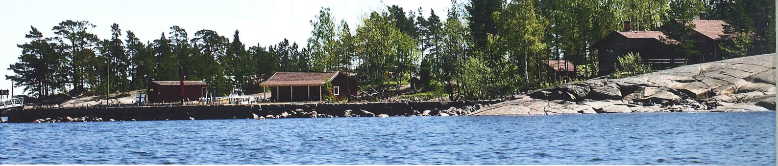
Boistön saaren vanhat rakennukset on kunnostettu yhdessä paikallisten tekijöiden voimin.

»Itämeren tilanne on edelleen kriittinen, mutta tulokset kannustavat.»